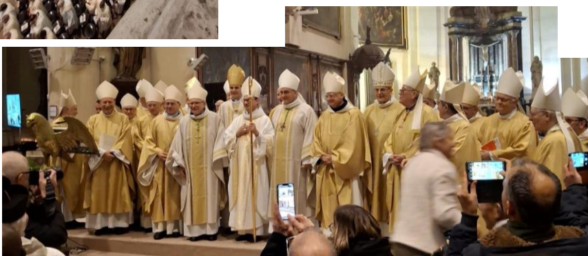
De nombreux prêtres et diacres dont plus de 50 assomptionnistes. Des évêques et cardinaux belges, luxembourgeois et français.