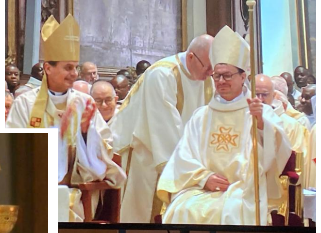
Le peuple de Dieu rassemblé pour l'action de grâce autour de Jésus-Christ et de son évêque.